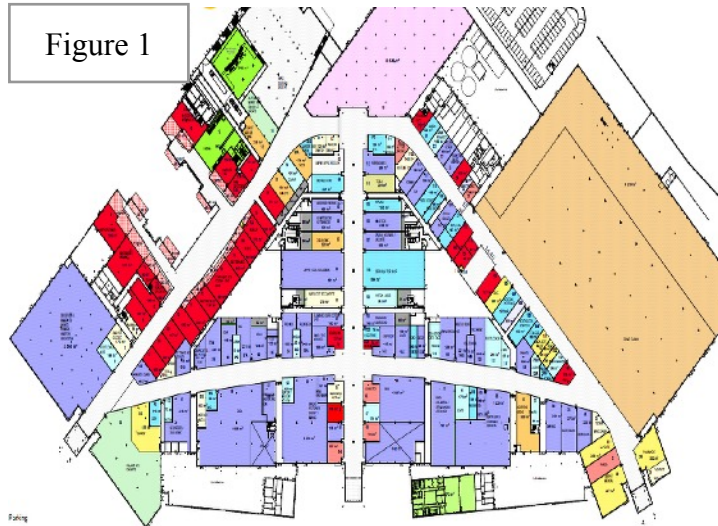
Illustration de boutiques « au centre d'un mail » (figure 1) : « Toutefois, les exploitations recevant de 51 à 700 personnes, situées au centre d'un mail , appliquent cumulativement les exigences suivantes :

Pour les exploitations recevant entre 51 et 700 personnes, la configuration particulière de certains mails, permet sous condition que les dégagements donnent tous dans le mail (article M 11 § 2) :